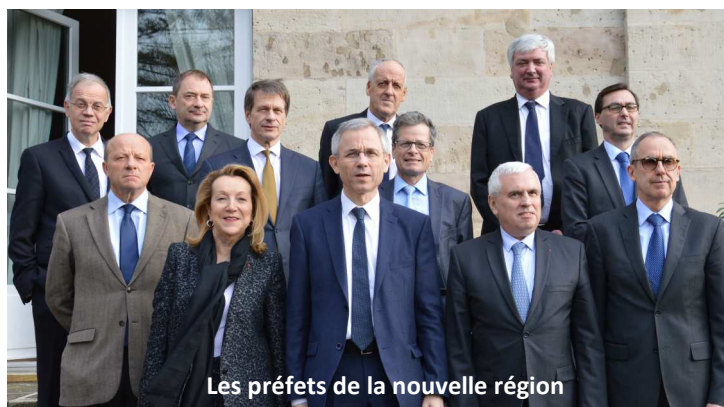
Les préfets de la nouvelle région

Le CAR est l'instance de pilotage des politiques publiques et de collégialité de l'Etat en région . Il réunit tous les deux mois, autour du préfet de Région qui le préside, les Préfets de département, le Recteur, le Directeur général de l'Agence Régionale de Santé, le Directeur régional des Finances Publiques , les Directrices et Directeurs régionaux (des Affaires Culturelles, de l'Alimentation de l'Agriculture et de la Forêt, des Entreprises, de la Concurrence, de la Consommation, du Travail et de l'Emploi, de la Jeunesse, des Sports et de la Cohésion Sociale, de l'Environnement, de l'Aménagement et du Logement), le Directeur Régional de l'INSEE et le Secrétaire général pour les Affaires Régionales et Européennes.