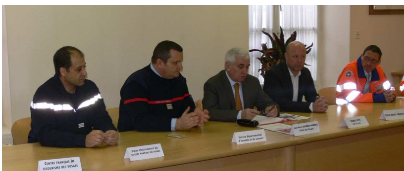
Présentation de l'opération « les gestes qui sauvent » par le Préfet des Vosges le 4 février 2016.

Pour aller plus loin : www.ilyadesgestesquisauvent.fr ou s'inscrire à l'initiation www.vosges.gouv.fr