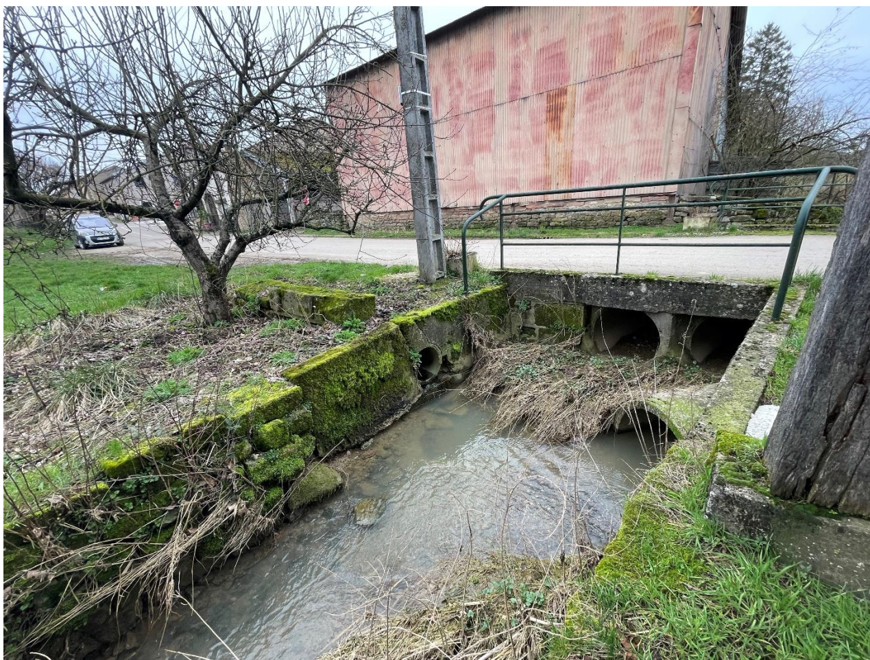
Photo 1 -Vue vers l'AMONT

→ Les photos sont identifiées et positionnées sur le plan topographique (pièce jointe n°2).