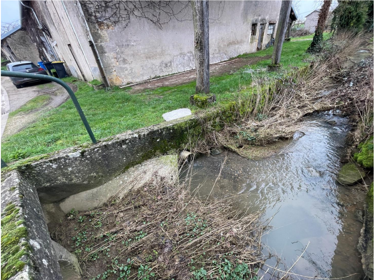
Photo 2 - Vue vers l'AVAL